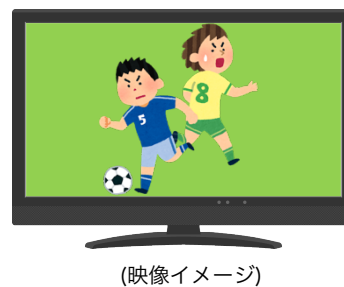
AIが映像を自動処理