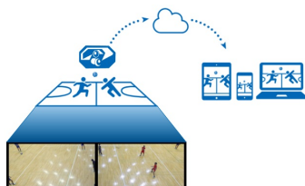
AIカメラがコート全体を撮影

「Pixellot」は現在、サッカー、バスケットボール、ラグビー、アメリカンフットボール、バレーボールなど14競技の撮影に対応しており「オートプロダクション」モードでは、本物のカメラマンが撮影しているかのような自然なカメラワークになります。