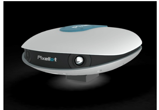
Stadium Tube Lite