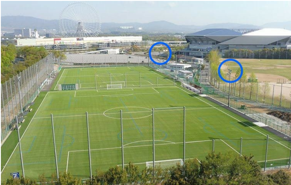
OFAフットボールセンターAIカメラ常設位置